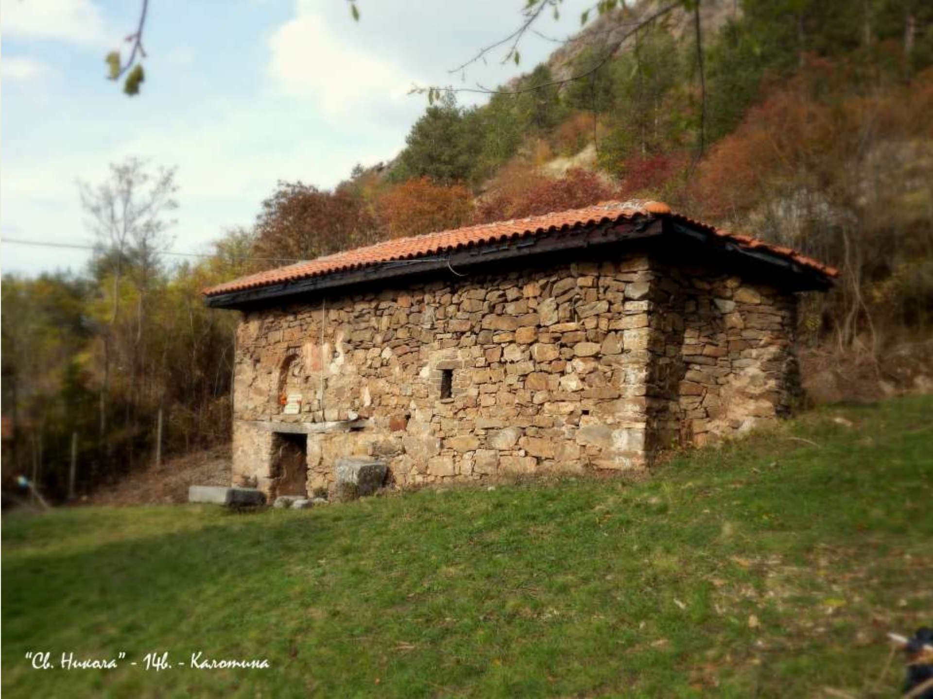
"Св. Никара" - 146. - Каромуна